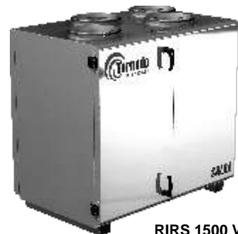
RIRS 1500 VE