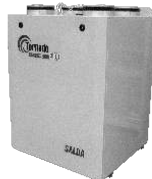
RIS 400 VEK EKO