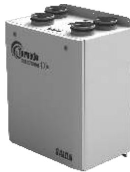
RIS 200 VEK EKO