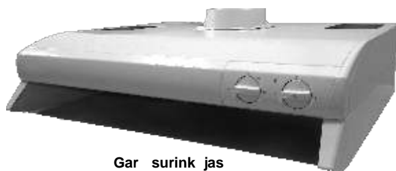
Gar surink jas